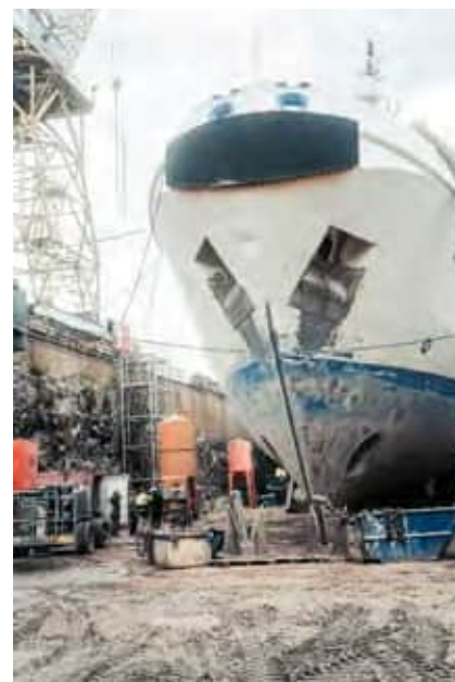
Under en torrdockning underhålls också färgytan.

På varvet pågår största delen av arbetet vid dockbassängen men det är också full fart i kontoret. Under dockningen höll varvets personal, bevakningsfartygets befälhavare, maskinchef och båtsman samt underhållschefen för fartygsenheten