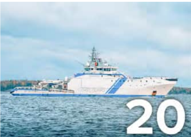
Traficom auditoi Rajan meriturvallisuusjärjestelmän.