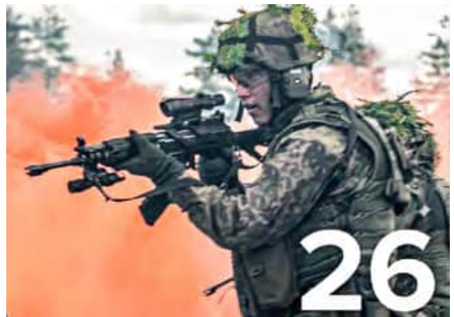
Erikoisrajajääkäreiden identiteetistä on tehty tutkimus.