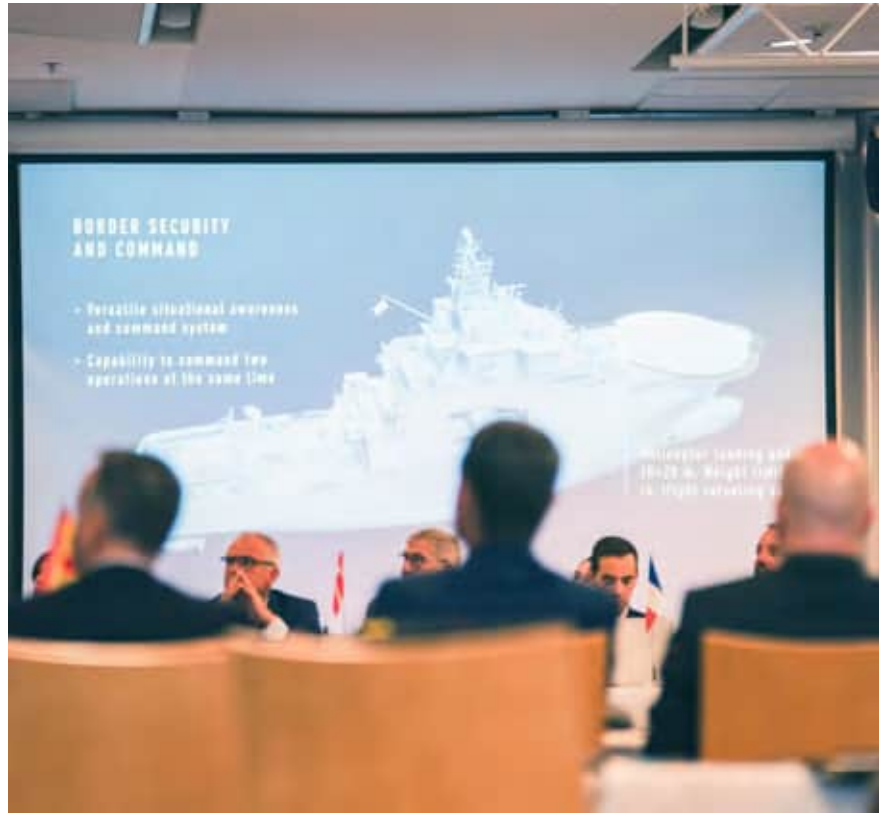
The new offshore patrol vessels of the Finnish Border Guard were presented at the summit.

The North Atlantic Coast Guard Forum (NACGF) was established in 2007. The objective of the Forum is to develop cooperation and the exchange of information between the coast guard authorities of the Member States in matters related to maritime security and coast guard functions. The members of the Forum include coast guard authorities from the Baltic Sea region, Western and Southern Europe as well as North America. The EU's maritime agencies also contribute to the Forum. The Finnish Border Guard has received support from the European Maritime, Fisheries and Aquaculture Fund (EMFAF) to carry out the chairmanship and to develop cooperation in coast guard functions.