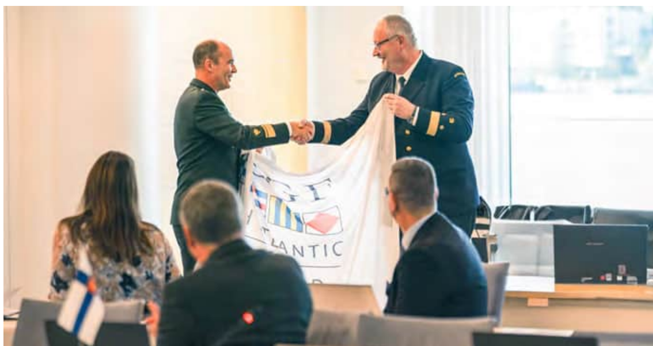
The Swedish Coast Guard took over the chairmanship of the North Atlantic Coast Guard Forum for 2024.

The number of remotely controlled and self-driving vessels is expected to increase rapidly over the coming decades, which will also significantly influence the activities of coast guard authorities. At the same time, the evolution of autonomous