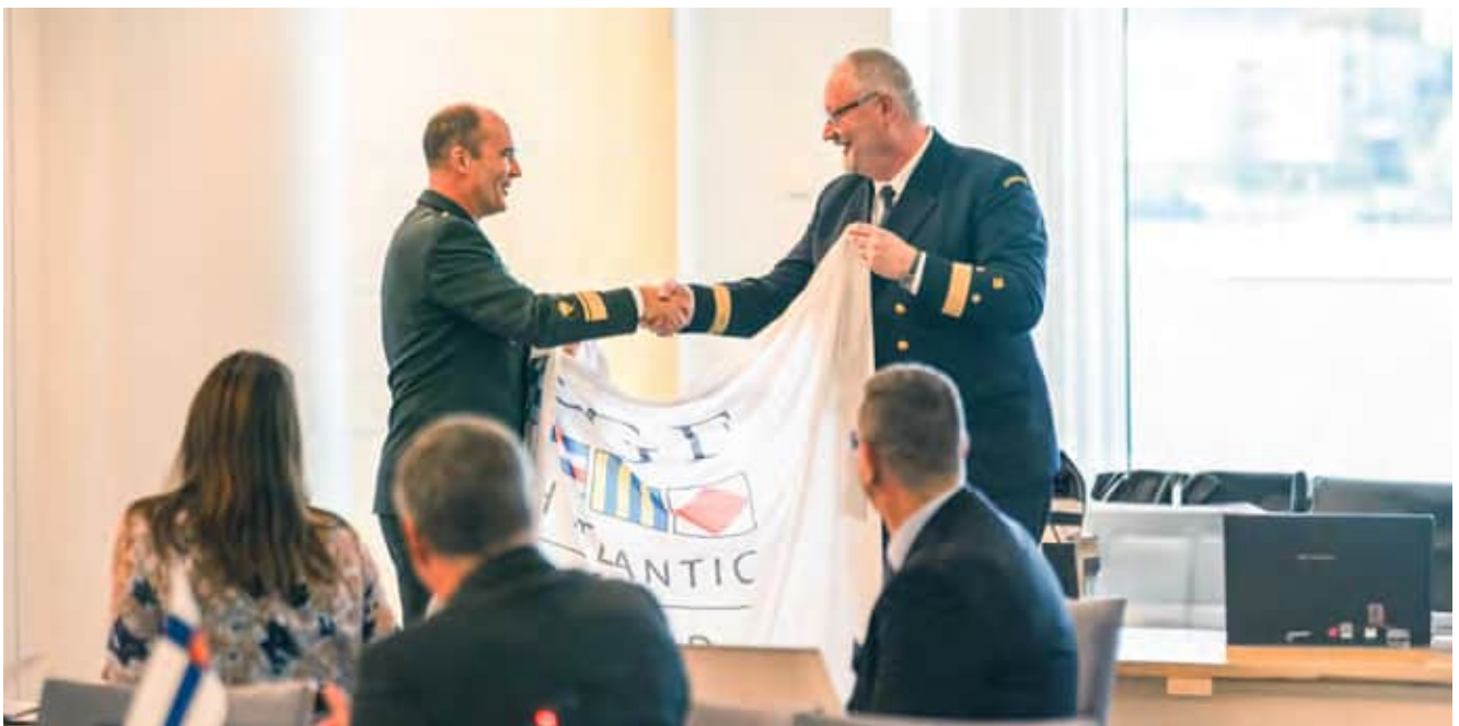
Nästa år är det Kustbevakningen i Sverige som innehar ordförandeskapet för forumet för kustbevakning i Nordatlanten.

Antalet fjärrstyrda och självstyrande fartyg uppskattas öka snabbt under de kommande årtiondena, vilket även kommer att ha en betydande inverkan på kustbevakningsmyndigheternas verksamhet.