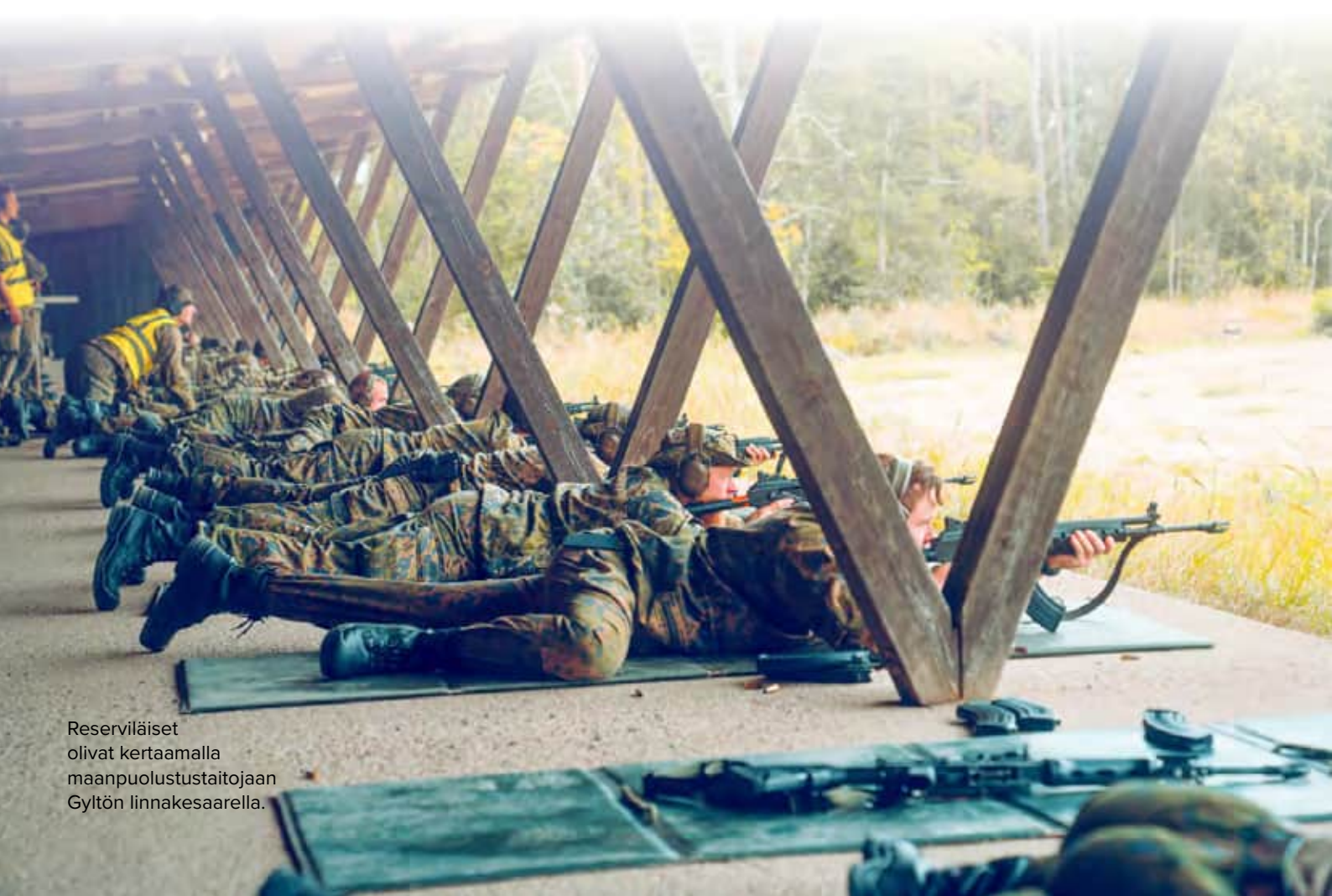
Reserviläiset olivat kertaamalla maanpuolustustaitojaan Gyltön linnakesaarella.