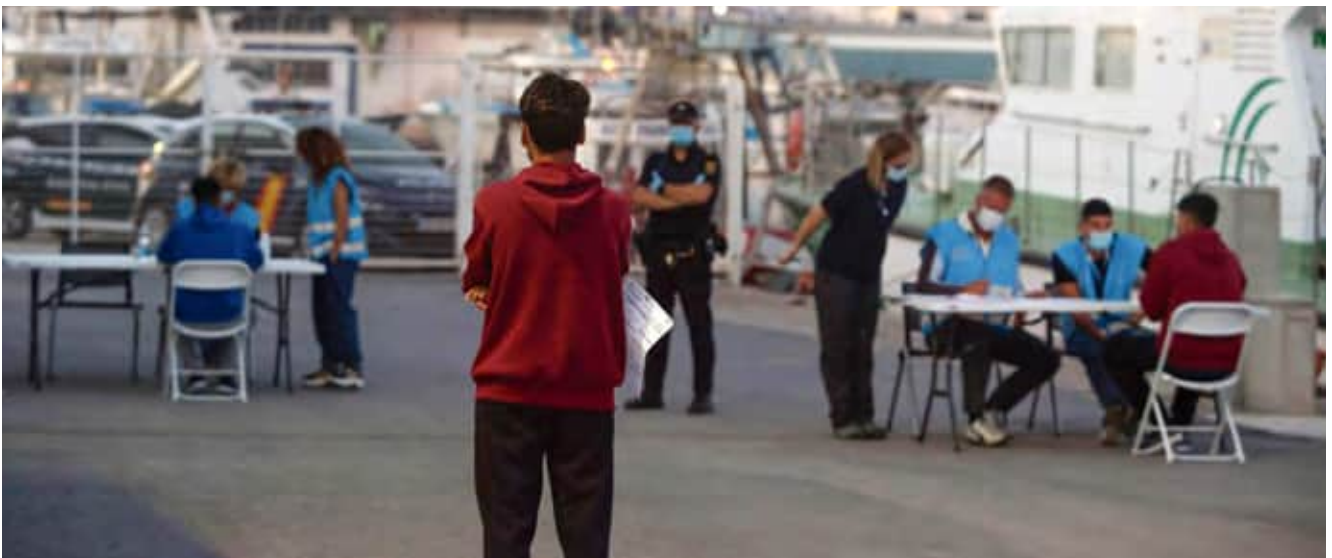
Frontexin asiantuntijat auttamassa Espanjan viranomaisia ulkorajavalvonnassa Välimeren ranta-alueilla.

– Teen seulontahaastatteluja ihmisille, jotka pyrkivät laittomasti Espanjaan Välimeren toiselta puolen. Työ on hyvin samantyyppistä kuin vakituksessa työpäikkäni Helsinki-Vantaan lentoaseman rajatarkastuksessa eli juttelen ihmisten kanssa, mutta täällä olen siviilivaatteissa. Sinällään työ on tuttua, mutta erittäin vaativaa ja mielenkiintoista.