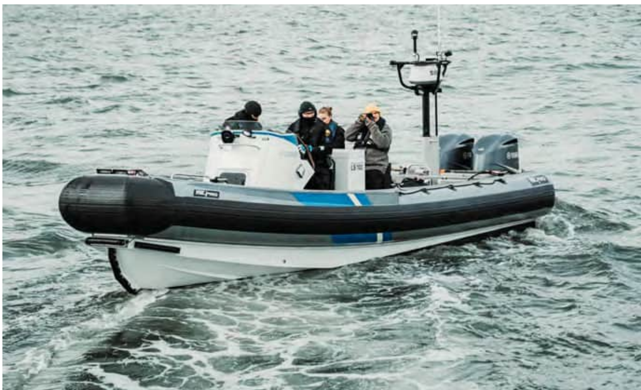
Länsi-Suomen merivartiosto järjestää säännöllisesti mediapäiviä tiedotusvälineille.

Kun tapahtuu jotakin poikkeavaa, median kiinnostus on suurta ja silloin puhelimet yleensä alkavat soida. Tämän Länsi-Suo-