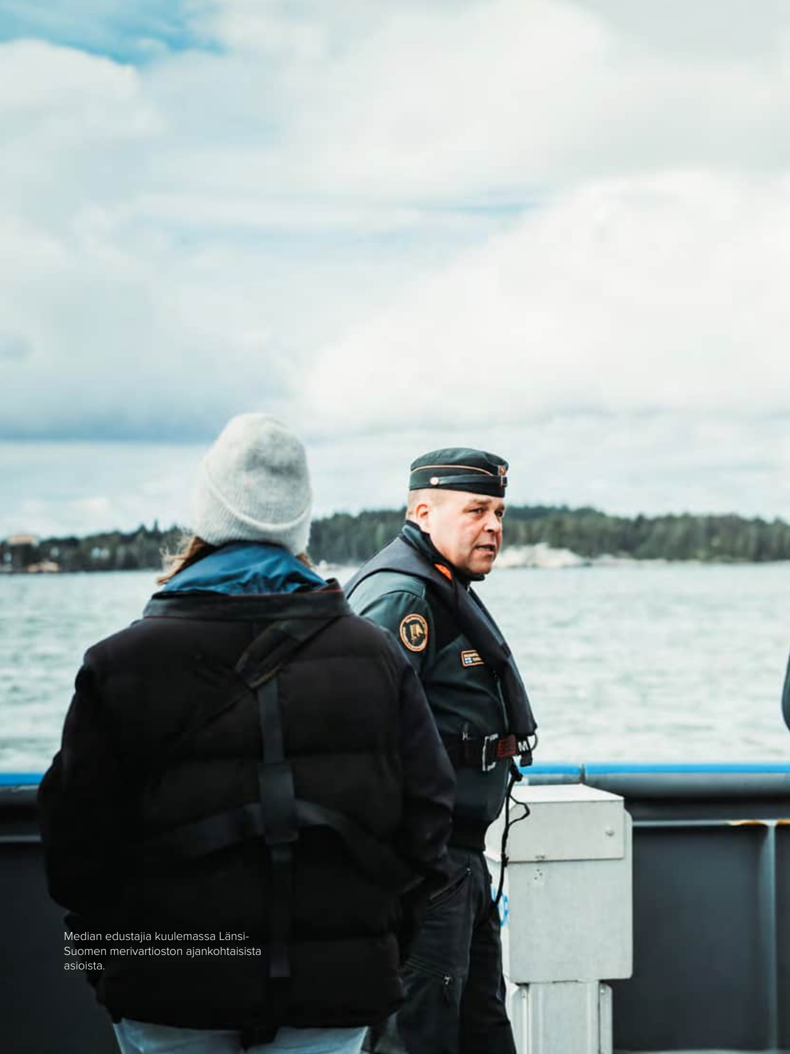
Median edustaja kuulemassa Länsi-Suomen merivartioston ajankohtaisista asioista.