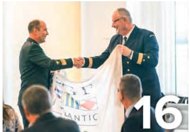
Pohjois-Atlantin rannikkovartiostofoorumin puheenjohtajuus siirtyi Suomelta Ruotsille.