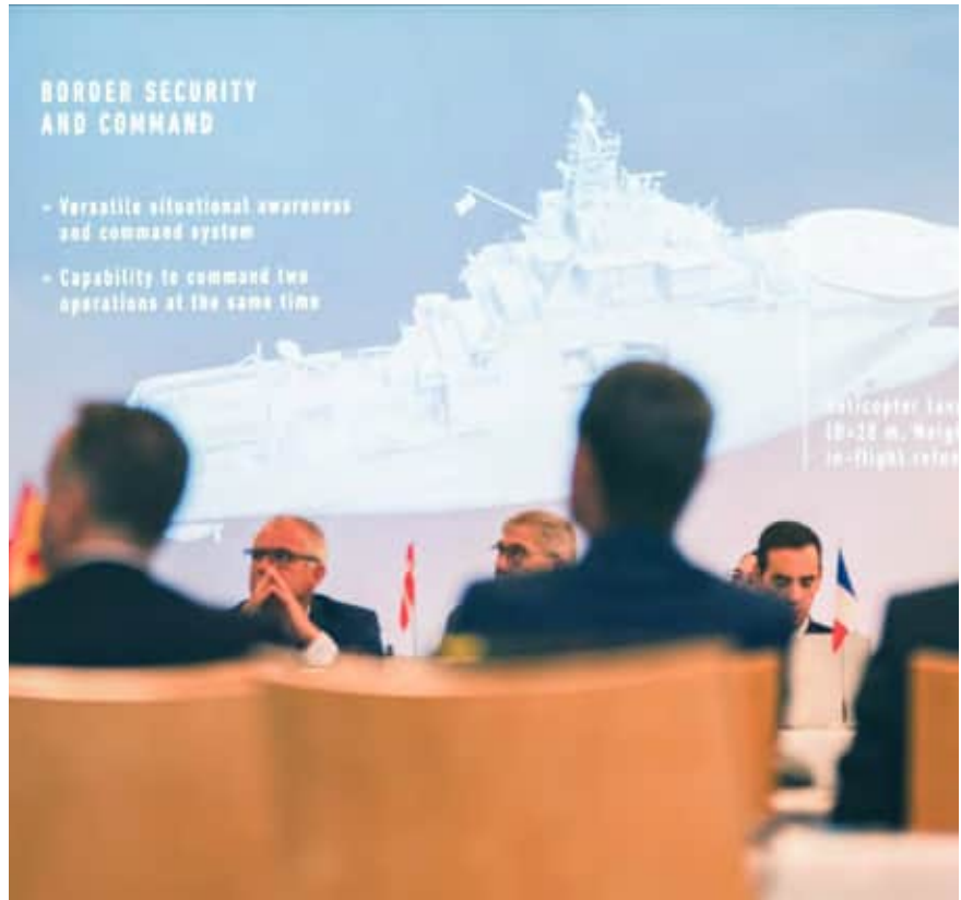
På chefsmötet förevisades Gränsbevakningsväsendets nya bevakningsfartyg.

Forumet för kustbevakning i Nordatlanten (North Atlantic Coast Guard Forum, NACGF) grundades 2007. Forumet har som mål att utveckla samarbetet och informationsutbytet mellan kustbevakningsmyndigheterna i frågor som gäller maritim säkerhet och kustbevakningsfunktioner. Forumets medlemmar består av kustbevakningsmyndigheter i Östersjöområdet, västra och södra Europa samt i Nordamerika. EU:s decentraliserade organ för den maritima sektorn deltar också i verksamheten. Gränsbevakningsväsendet har tagit emot finansiering ur Europeiska havs-, fiskeri- och vattenbruksfonden (EHFVF) för att utveckla kustbevakningssamarbetet och genomföra ordförandeperioden.