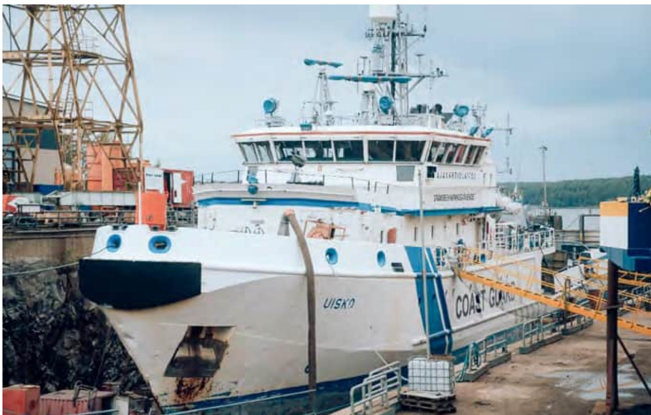
Under underhållsarbetet stod Uisko på kölblock i en tom bassäng.

Under torrdockning utförs sådana underhålls-, reparations- och installa-