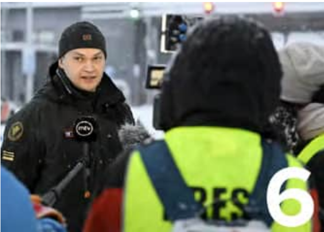
Poikkeusoloissa paikan päällä tapahtuvalla tiedottamisella varmistetaan kansalaisten tiedonsaanti.