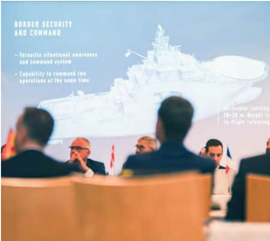
Päällikkökokouksessa esiteltiin Rajavartiolaitokselle rakennettavia uusia vartiolaivoja.

van nopeasti tulevien vuosikymmenten aikana, mikä tulee merkittävällä tavalla vaikuttamaan myös rannikkovartiostoviranomaisten toimintaan. Vastaavasti autonomisten ja miehittämättömien teknologioiden kehittyminen tuo mukanaan uusia mahdollisuuksia viranomaisille, jotka voivat hyödyntää nopeasti kehittyviä järjestelmiä tehostaakseen omaa toimintaansa.